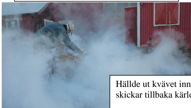
Hällde ut kvävet innan vi skickar tillbaka kärlet.

Målet är få in nytt "blod" till vår besättning utan att köpa levande bagge. Det minskar risken för smittor till våra djur. Vi behöver också hitta "toppbaggar" som matchar våra fina tackor. Vi är nu rankade 2: a i Sverige på pälskvalitet (avelsvärde).